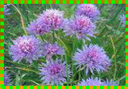
Лук - шнитт