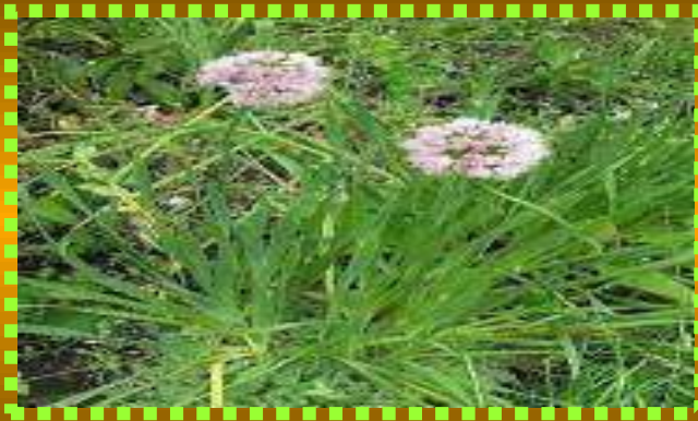
Лук - слизун