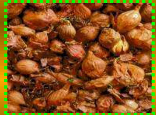
Лук - шалот