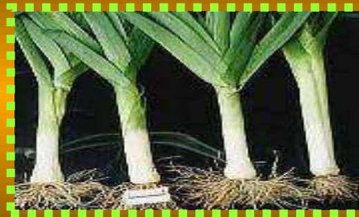
Лук - порей