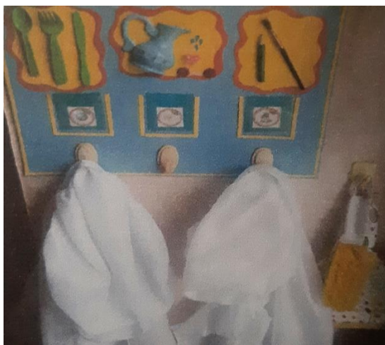
Стенд «Мы дежуриим». Фартуки, колпачки, салфетки, салфетницы