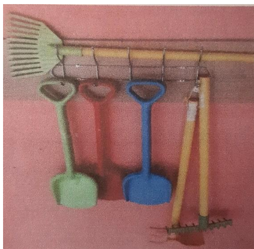
Уличные грабли, метелки, веники