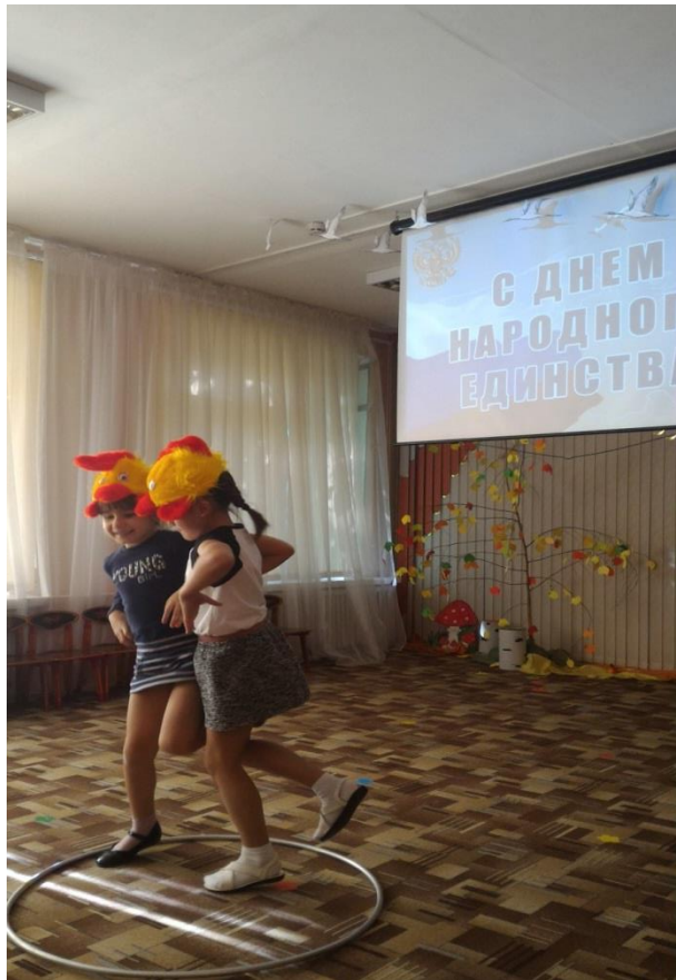
Подвижная игра «Бой петухов»