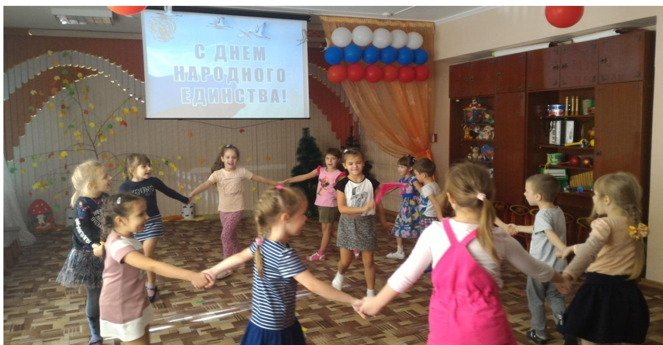
Народная игра «Гори, гори – ясно»