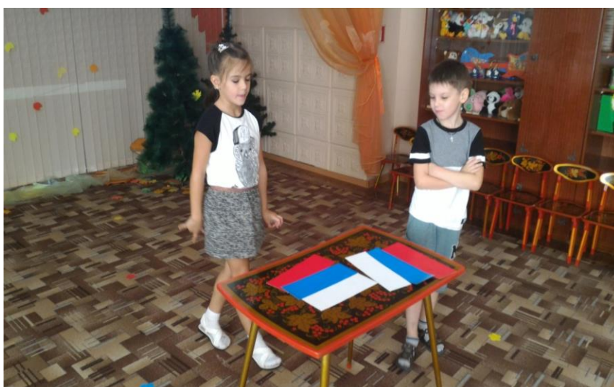
Дидактическая игра «Собери флаг России»