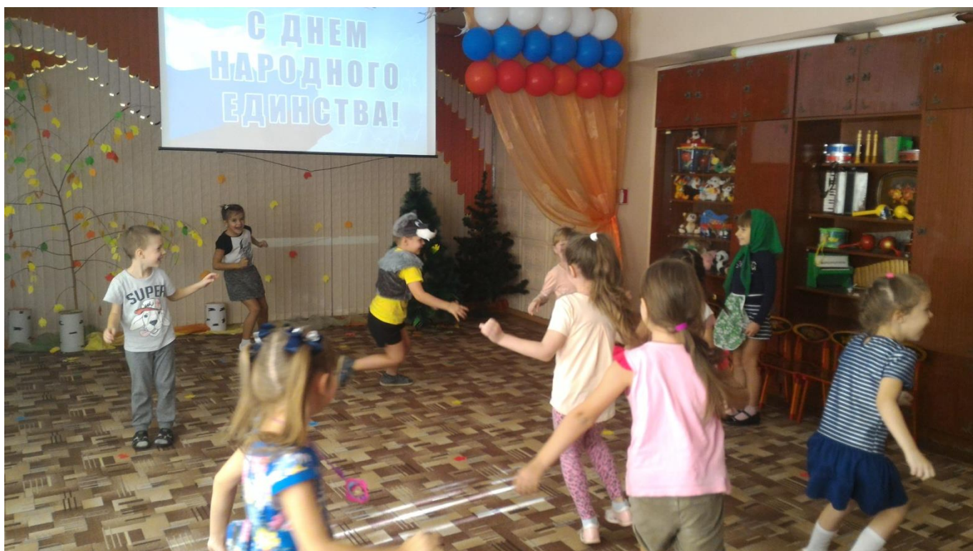
Подвижная игра «Гуси-лебеди»

Педагоги вместе с детьми вспомнили русские народные игры.